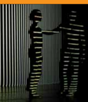
Städteübergreifend und international: das Figurentheater-Festival.

Heinrich-Lades-Halle Rathausplatz 1 91052 Erlangen Tel. 8 74-0, Fax 8 74-1 50 www.ekm-erlangen.de