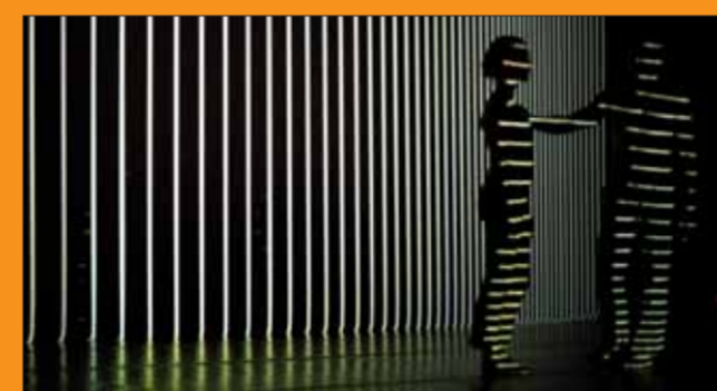
Städteübergreifend und international: das Figurentheater-Festival.

Kultur und Freizeit Freizeitzentrum Frankenhof Südliche Stadtmauerstraße 35 91054 Erlangen Tel. 86 28 60 Fax 86 21 19