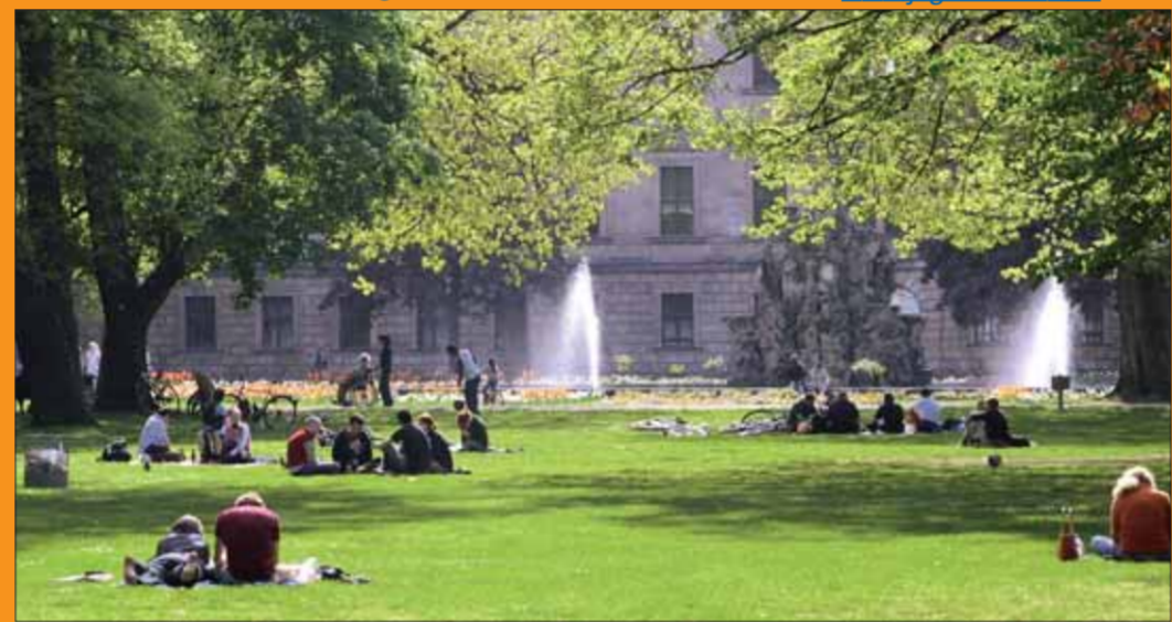
Beliebter Treffpunkt für Erlangens Bürger und Besucher: der Schlossgarten.

Auskünfte über die Einkaufsmöglichkeiten in der Innenstadt erteilt auch das City-Management Erlangen.