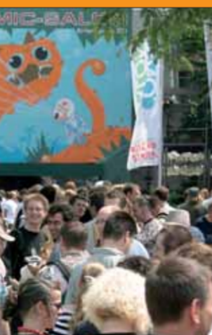
Der Comic-Salon zieht alle zwei Jahre die Menschen in seinen Bann.

Ebenerdiger Zugang vom Parkplatz südl. Stadtmauerstraße