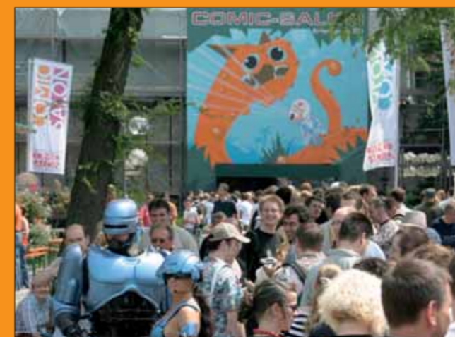
Der Comic-Salon zieht alle zwei Jahre die Menschen in seinen Bann.

Ebenerdiger Zugang vom Parkplatz südl. Stadtmauerstraße