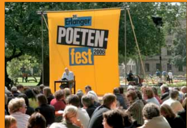
Veranstaltungshighlights wie das Poetenfest sind auch für Menschen mit Behinderung leicht zugänglich.

Beide Broschüren sind erhältlich bei der Behindertenberatung, Tel. 862498 oder online unter: www.erlangen.de/behindertenberatung